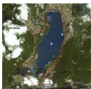
Lago di Comabbio

Comabbio; Mercallo; Ternate; Varano Borghi; Vergiate.