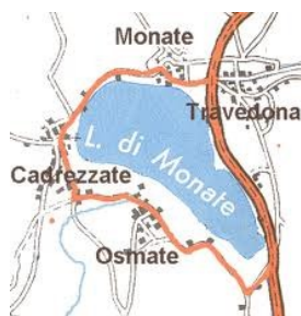
Lago di Monate

Cadrezzate con Osmate; Comabbio; Travedona Monate.